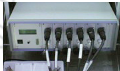
LLF-M with 6 signal channels