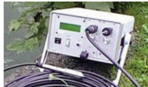
LLF-M with 2 signal channels